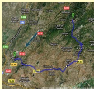
Plasencia Piornal por la Vera (Recomendable)